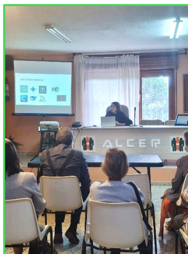
Imagen: taller grupal sobre cuidados de alimentación y salud en tiempos de inteligencia artificial.